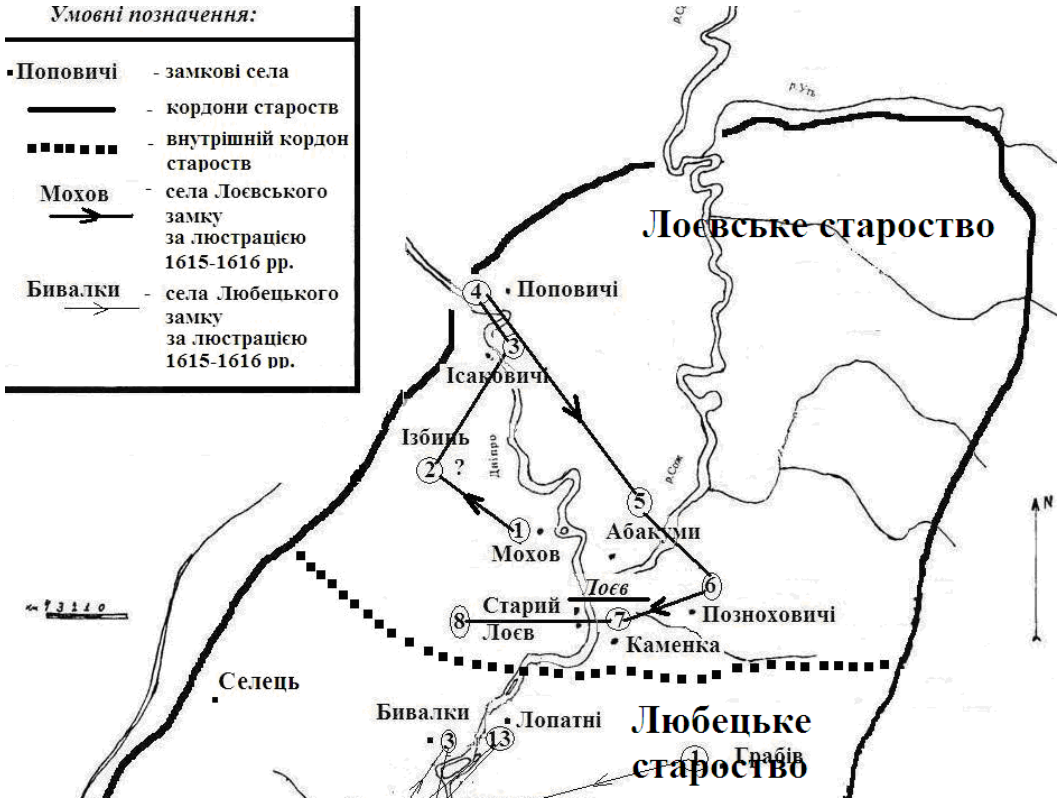
Рис. 1. Лоєвське староство за матеріалами королівських люстрацій першої половини XVII ст.